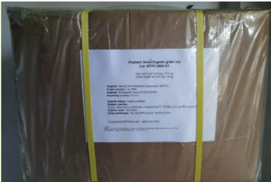
ສະຫຼາກກ່ອງຊາສໍາລັບສົ່ງອອກ ຂອງ ສະຫະກອນຜູ້ຜະລິດຊາເມືອງເມິງ (ຂາຍສິ່ງ)