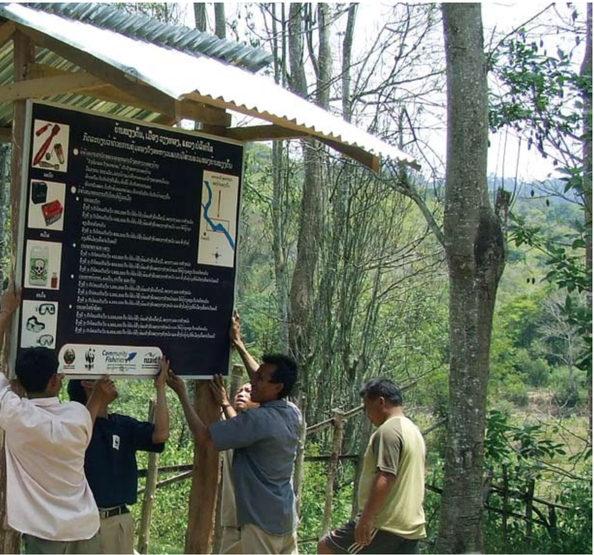
ເຊັ່ນ: ອຳນາດການ ປົກຄອງບ້ານ, ຫ້ອງການກະສິກຳ-ປ່າໄມ້ເມືອງ, ຫ້ອງການ ປົກຄອງເມືອງ ແລະ ພະແນກກະສິກຳ ແລະ ປ່າໄມ້ແຂວງ.